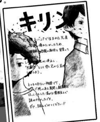
※ 第3回ポップコンテストの入賞作品です。